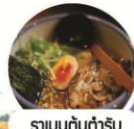
ราเมนต้นตำรับ

เที่ยวเต็มไม้ป๊อระ- เมนู นูฟฟัดชาปูฮันย์ จองเลย