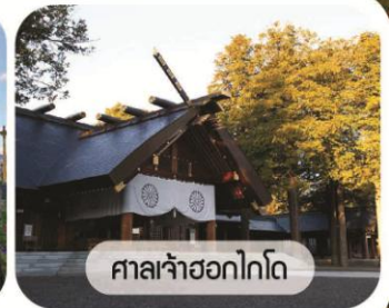
ศาลเจ้าซอกไกโด